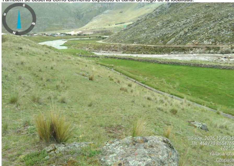
Foto 02.- Se observa como elementos expuestos pocas viviendas, áreas de pastos para ganado, ubicados en las margenes del río Cunas.

Foto 01.- Se observa el punto de inicio en el sector de Achipampa-distrito de Yanacancha. También se observa como elemento expuesto el canal de riego de la localidad.